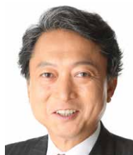
鳩山由紀夫さん (元内閣総理大臣)