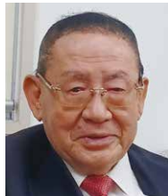
山崎拓さん (元自民党副総裁)