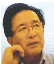
伊波洋一さん (参議院議員)